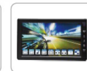
7" LCD Monitor (オプション品)