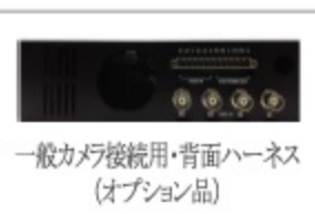
一般カメラ接続用・背面ハーネス (オプション品)