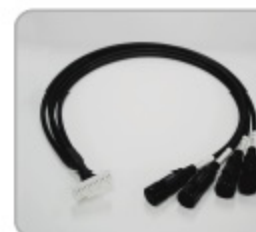
専用カメラ用ハーネス