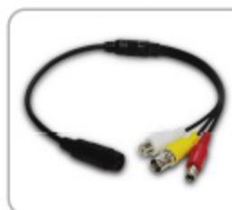
一般CCTVカメラ用 変換ケーブル (オプション品)