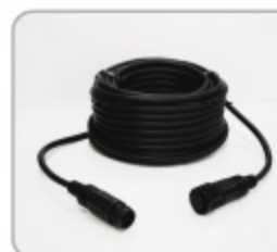
延長ケーブル 最大24M使用可能